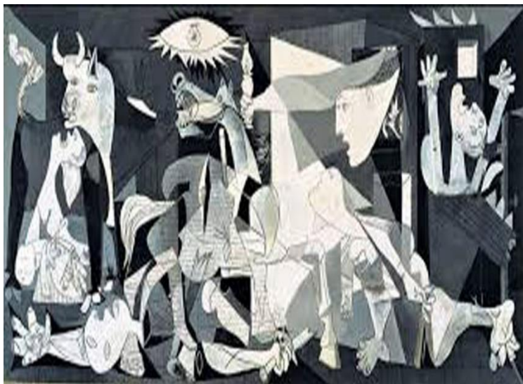
“Guernica” mural anónimo a partir de la obra de Pablo Picasso.